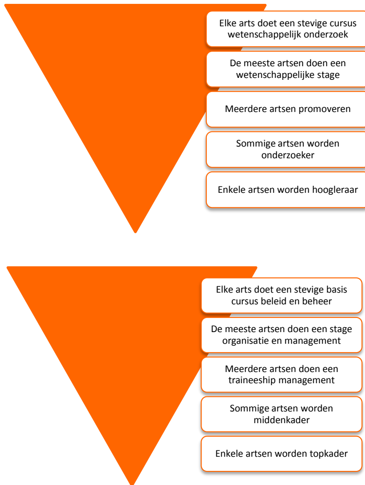
Figuur 1: Inbedding CanMeds competentie Wetenschap en potentiële inbedding van de competentie medisch leiderschap